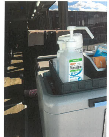
アルコール消毒完備