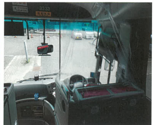
運転席シールドカバー設置