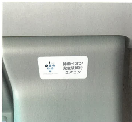
除菌イオン発生装置付エアコン